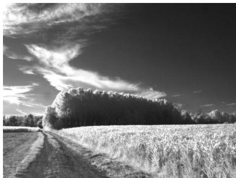
"Bassa friulana"

Mandaci le tue foto migliori o le più curiose e divertenti! Le pubblicheremo su questo Notiziario e premieremo quelle più interessanti.